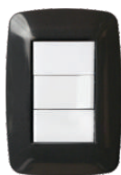
Gris Topo 03241 04