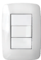
Blanco 03241 02