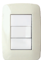
Verde Pastel 03241 11