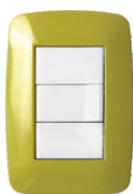
Verde 03241 14