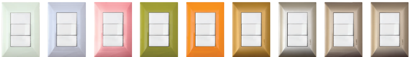
Verde Pastel 03245 11