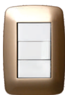
Champagne Bicapa 03241 29