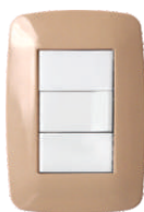
Beige 03241 03