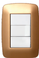
Oro Mate Satinado 03241 23