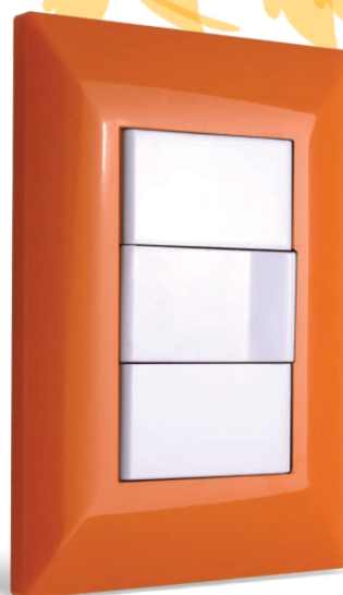
exultt duna más