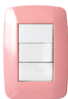
Rosa Pastel 03241 13