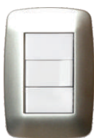
Plata Satinado 03241 24