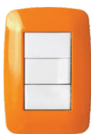
Naranja 03241 15