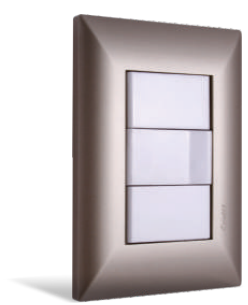
exultt duna más