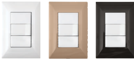
Blanco 03245 02