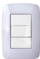
Celeste Pastel 03241 12